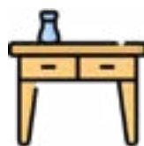
Plan de pose ou de travail