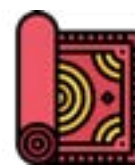
Décoration textile (depuis 2022)